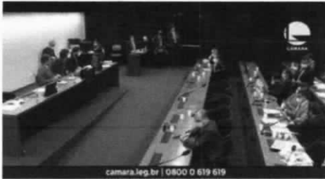
Foram mais de sete horas de discussão sobre o relatório da Reforma Administrativa na Comissão Especial. O texto será agora analisado pelo Plenário da Câmara

PONTOS CRITICADOS Vários trechos do relatório foram criticados. Um dos pontos fortemente criticado,